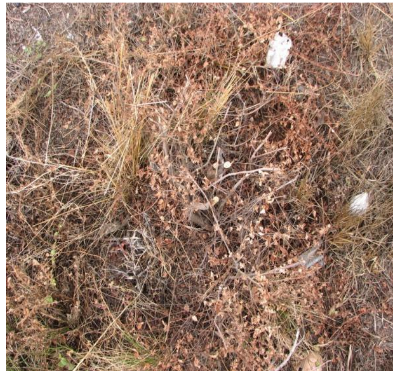
Грейдер, 4 л/га + Адю, 0,2 л/га (45 дней после обработки)