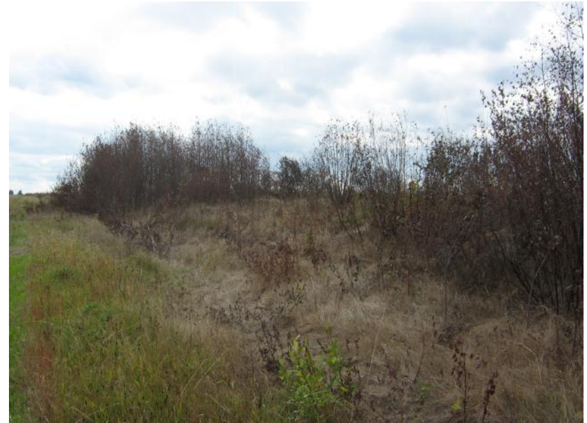
Грейдер, 5 л/га + Адью, 0,2 л/га (60 дней после обработки)