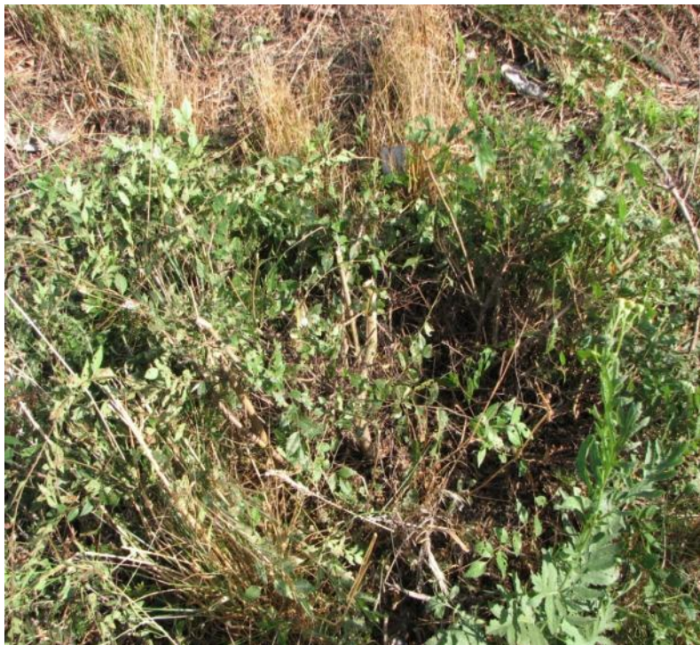
Контроль без обработки