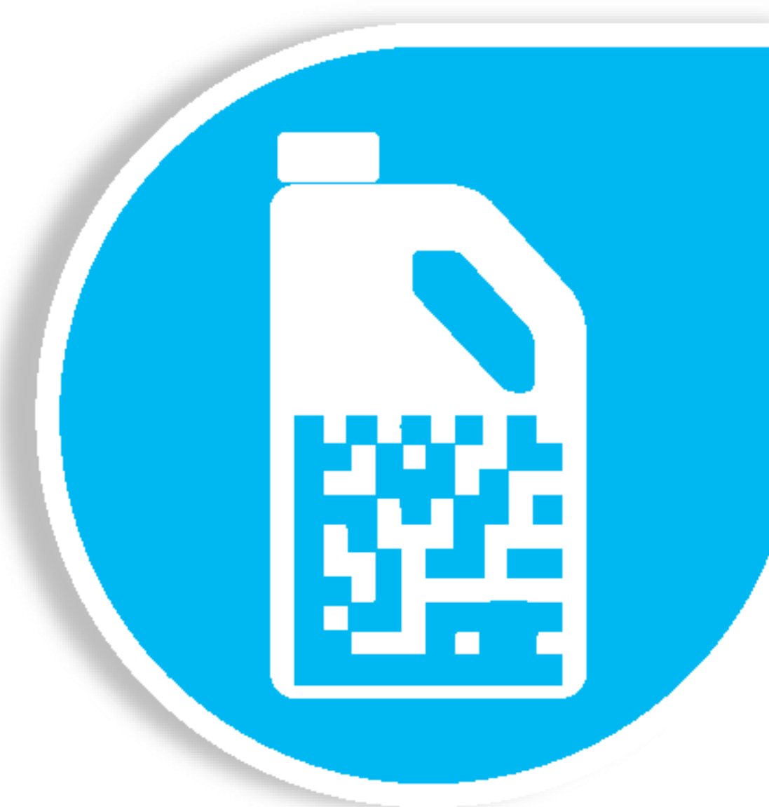
Август Чекер. Защита от контрафакта