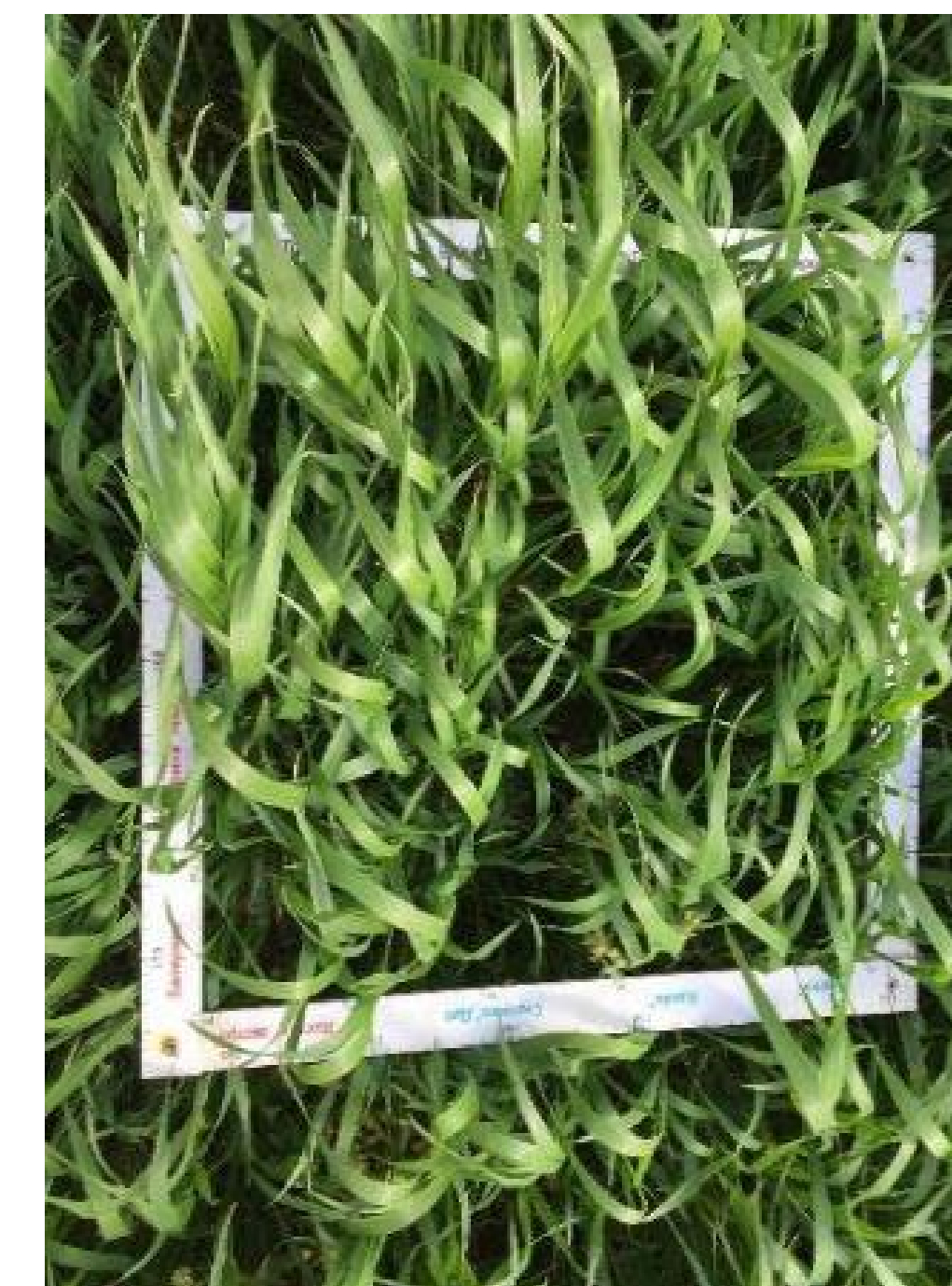
Общий вид посева