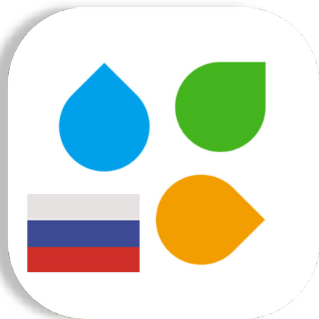
Каталог продукции для России и Беларуси