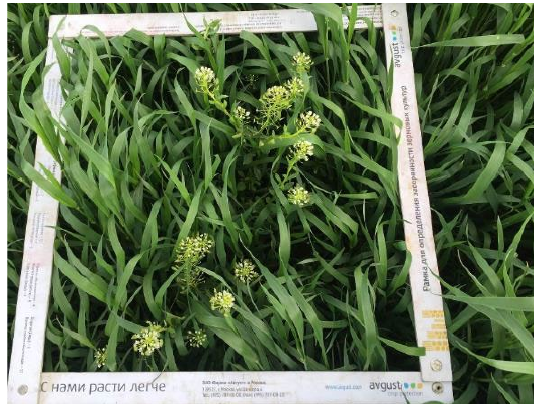
Контроль без обработки