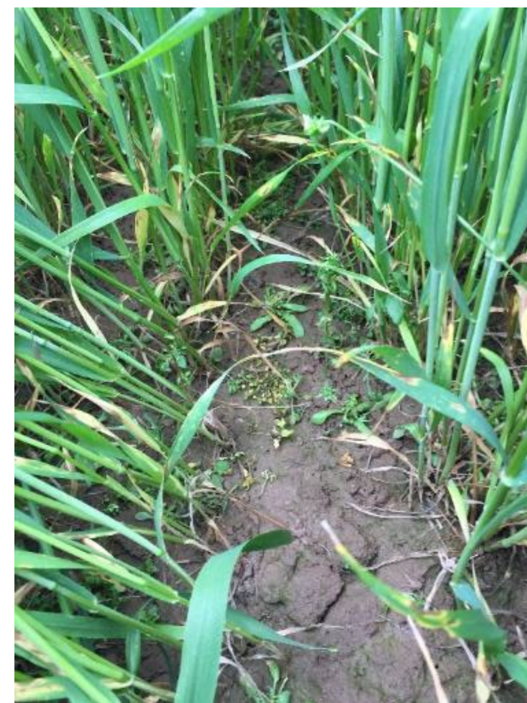
Общий вид посева