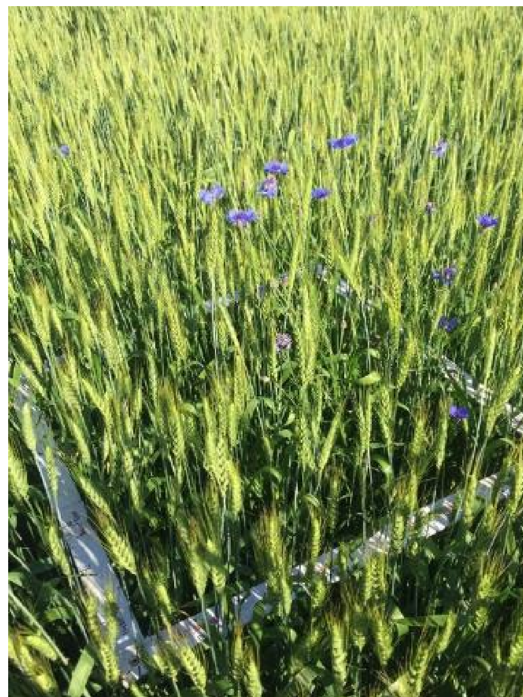
Контроль без обработки