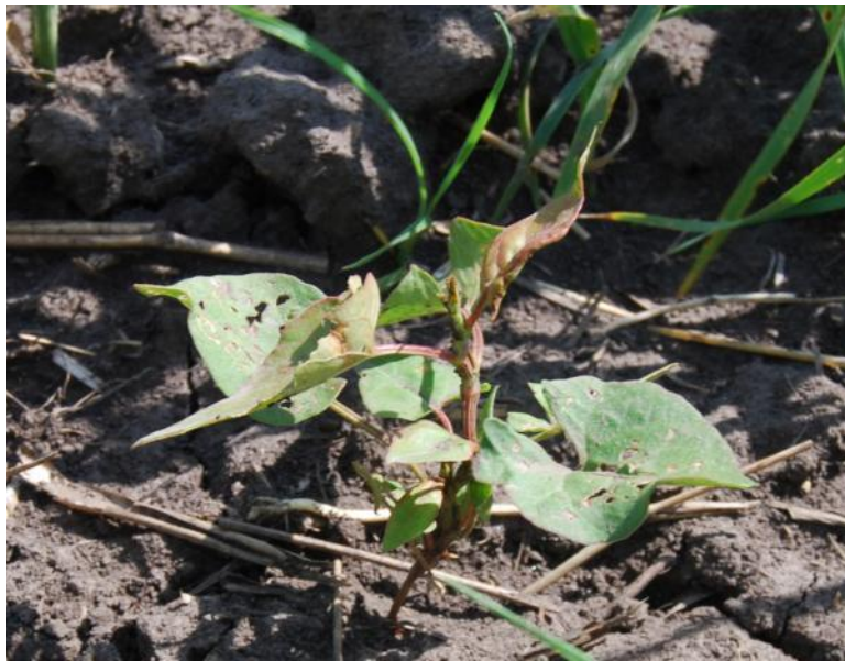
Контроль без обработки