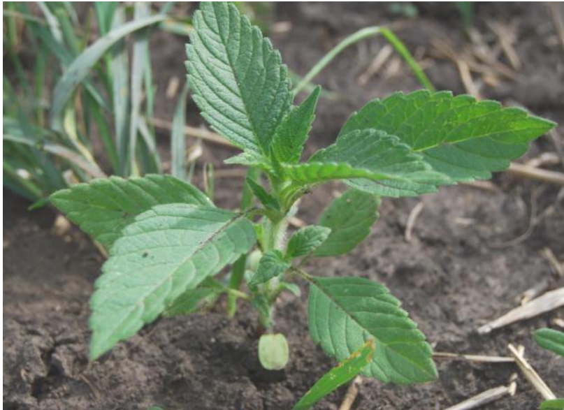
контроль без обработки