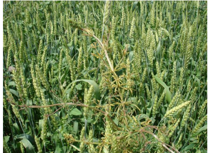
Подмаренник после обработки Деметрой микс