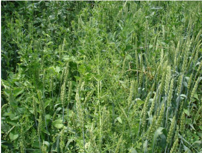
сорняки в контроле без обработки