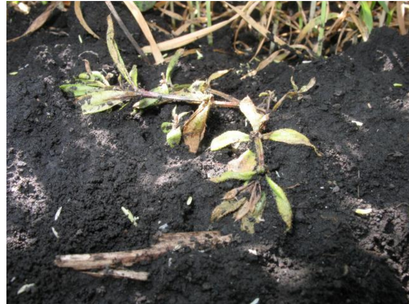
подмаренник после обработки Балериной микс