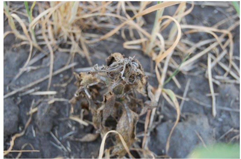
Мортира, 20 г/га (через 30 дней после обработки)