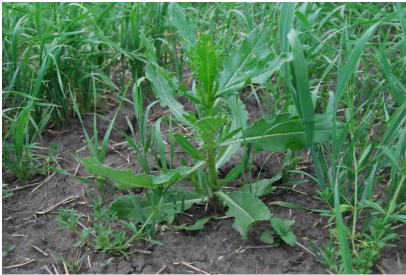
контроль без обработки