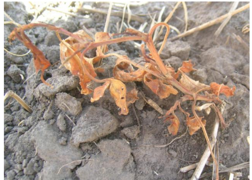
Мортира, 20 г/га (через 30 дней после обработки)