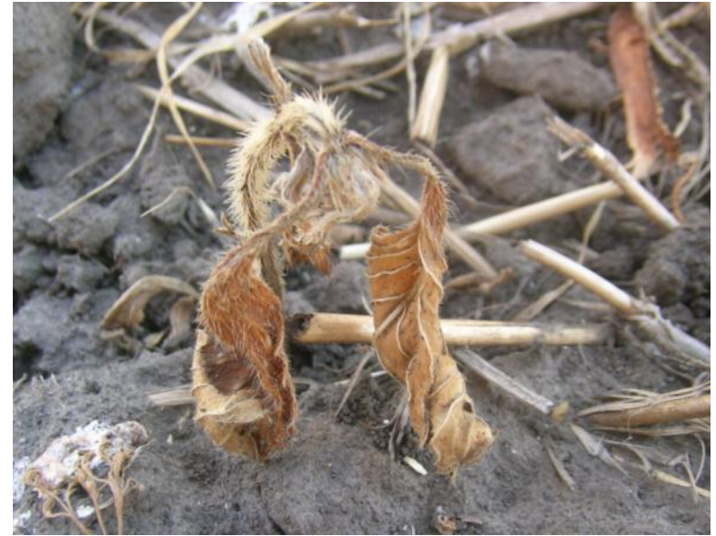
Мортира, 20 г/га (через 30 дней после обработки)