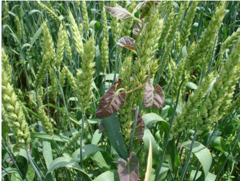
Вьюнок после обработки Деметрой микс