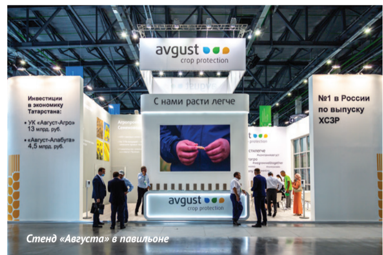
Стенд «Августа» в павильоне

ний, так как не у всех есть нужные емкости и мощности для их хранения. Мы берем эту функцию на себя: за последние годы в разы увеличили объем единовременного хранения жидких удобрений по всей сбытовой сети. Кстати, в условиях дефицита влаги жидкие удобрения работают лучше, это актуально для сезона-2021.