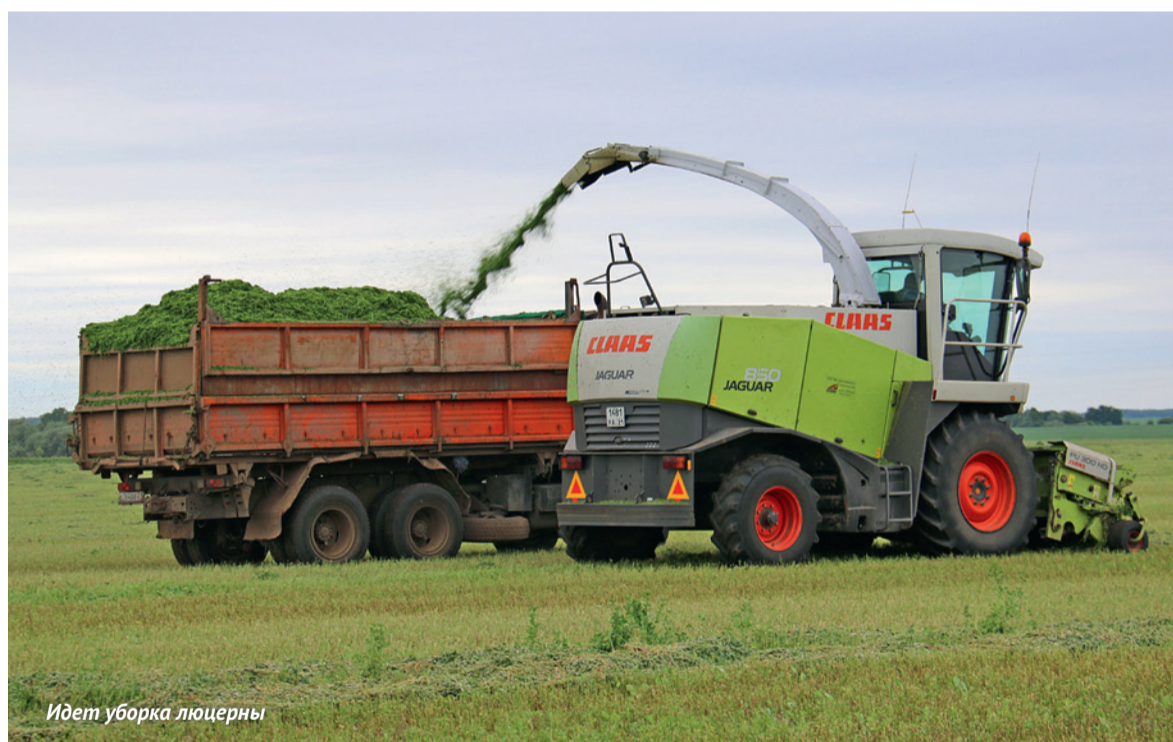
Идет уборка люцерны