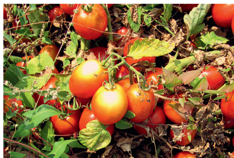
Самая высокая опасность солнечного ожога на томате возникает после раскладывания куста

го повышенной влажности почвы в сочетании с обильным азотным питанием всегда сдвигает культуру в «вегетативную сторону», несколько оттягивая цветение и завязывание плодов, давая растению возможность развить мощную листовую массу. Тогда как дефицит влаги, а также резкие перепады влажности почвы «разворачивают» растение к генеративному типу развития, ускоряя цветение и плодообразование, что крайне нежелательно после серьезных ожогов.