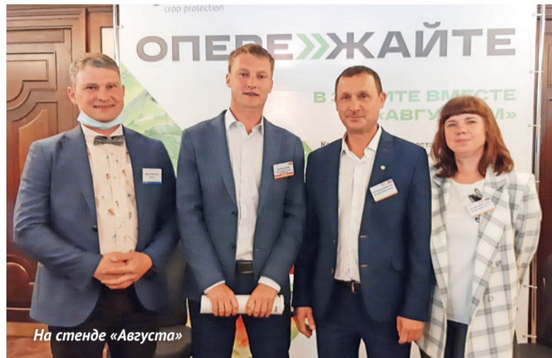
На стенде «Августа»