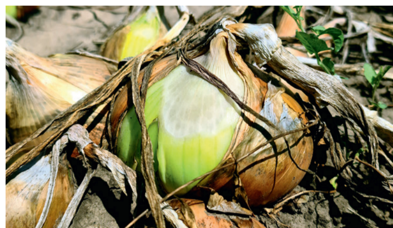
Усыхание ботвы открывает солнечным лучам поверхность луковиц, ранее находившуюся в тени. И если слишком затянуть с уборкой, то значительная часть урожая может быть повреждена солнечными ожогами

Стоит по возможности скорректировать и водный режим. Поддержание стабильной и немно-