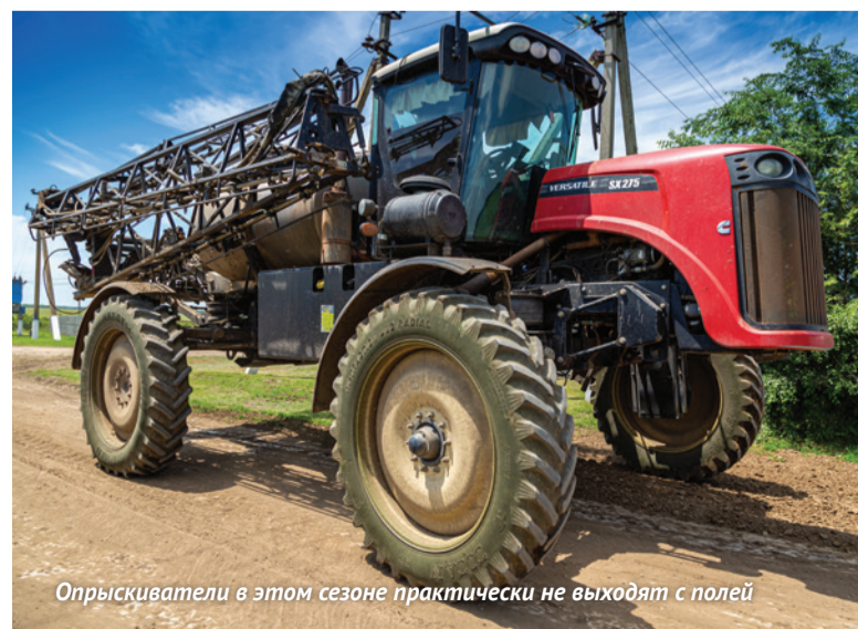
Опрыскиватели в этом сезоне практически не выходят с полей

Я уже говорил, что из технических культур у нас есть сахарная