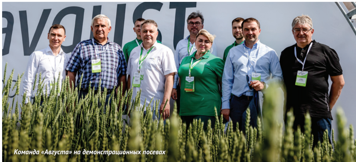
Команда «Августа» на демонстрационных посевах

Эта крупная агропромышленная выставка прошла 1 - 3 июля в Казани на территории МВЦ «Казань Экспо». 304 организации из 30 регионов России продемонстрировали здесь свои достижения. Компания «Август» стала генеральным спонсором мероприятия.