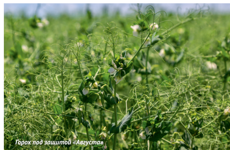
Горох под защитой «Августа»

Руководство постоянно поддерживает и мотивирует наших сотрудников. По итогам года лучшим работникам вручают новые автомобили, остальные награждают достойные премии. За счет СПК люди ездят отдыхать на море или в санаторий. Нет мелочей, когда речь идет о коллективе.