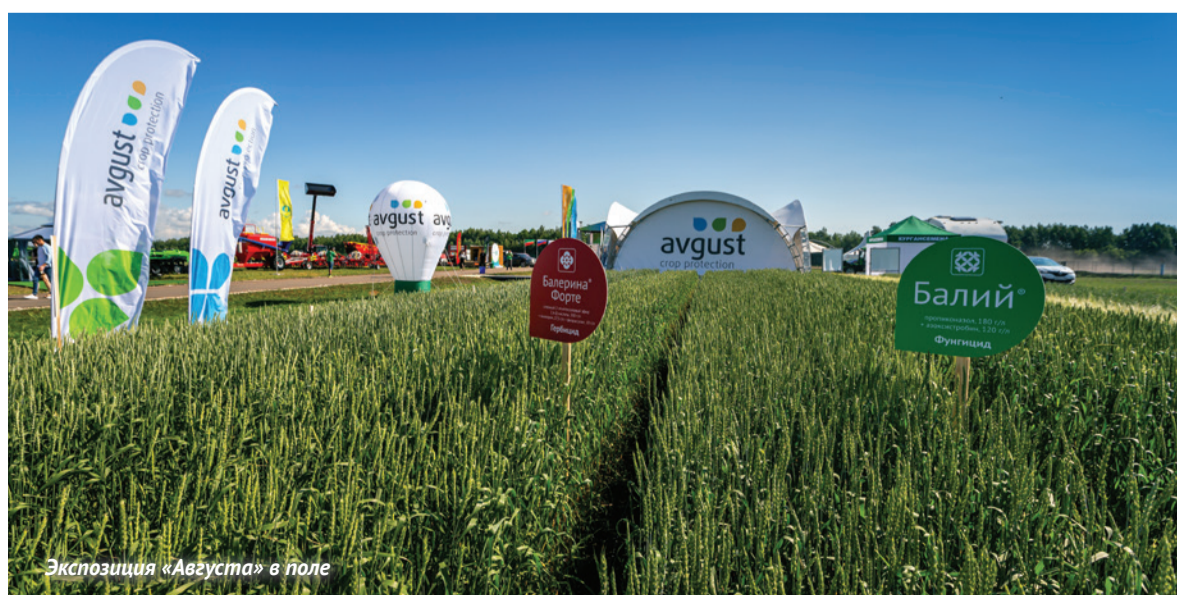
Экспозиция «Августа» в поле