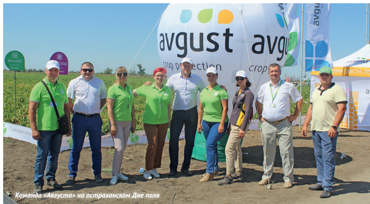
Команда «Августа» на астраханском Дне поля