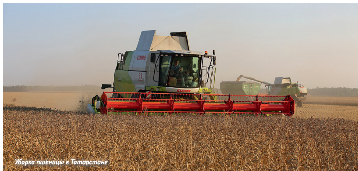
Уборка пшеницы в Татарстане