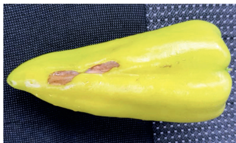
Повреждение перца солнечным ожогом всегда находится на внешней стороне плода и имеет поверхностный, пленчатый характер