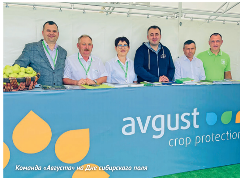
Команда «Августа» на Дне сибирского поля