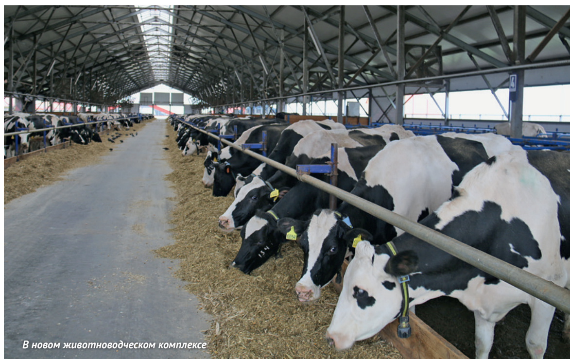
В новом животноводческом комплексе