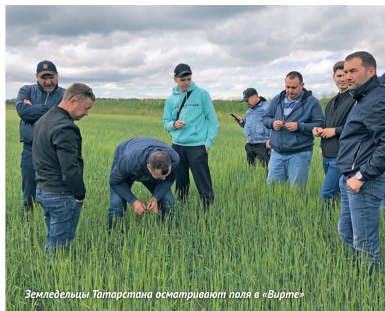
Земледельцы Татарстана осматривают поля в «Вирте»