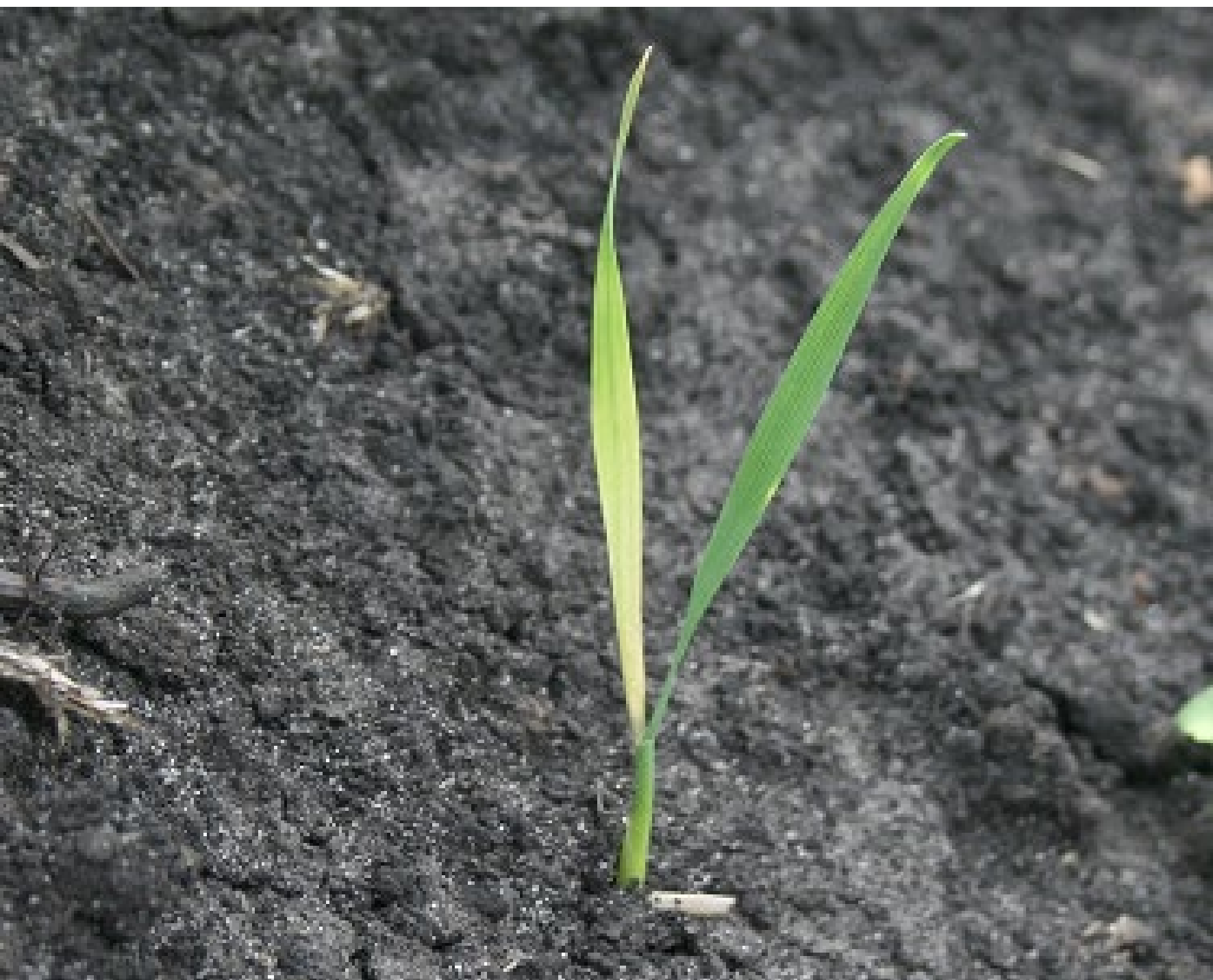
Через 3 дня после обработки