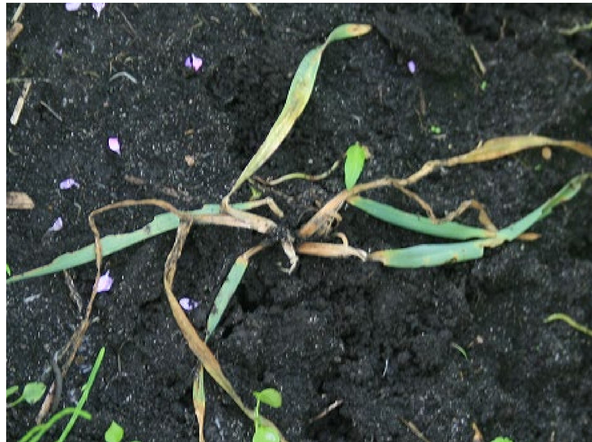
Через 20 дней после обработки