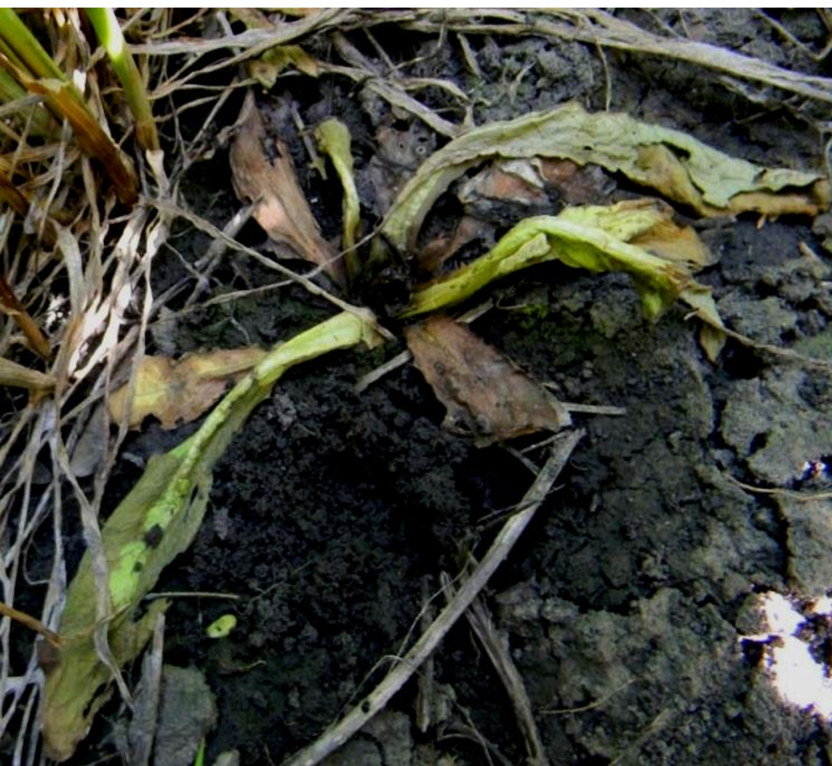
Бомба, 20 г/га

Краснодарский край. Бомба против осота через 30 дней