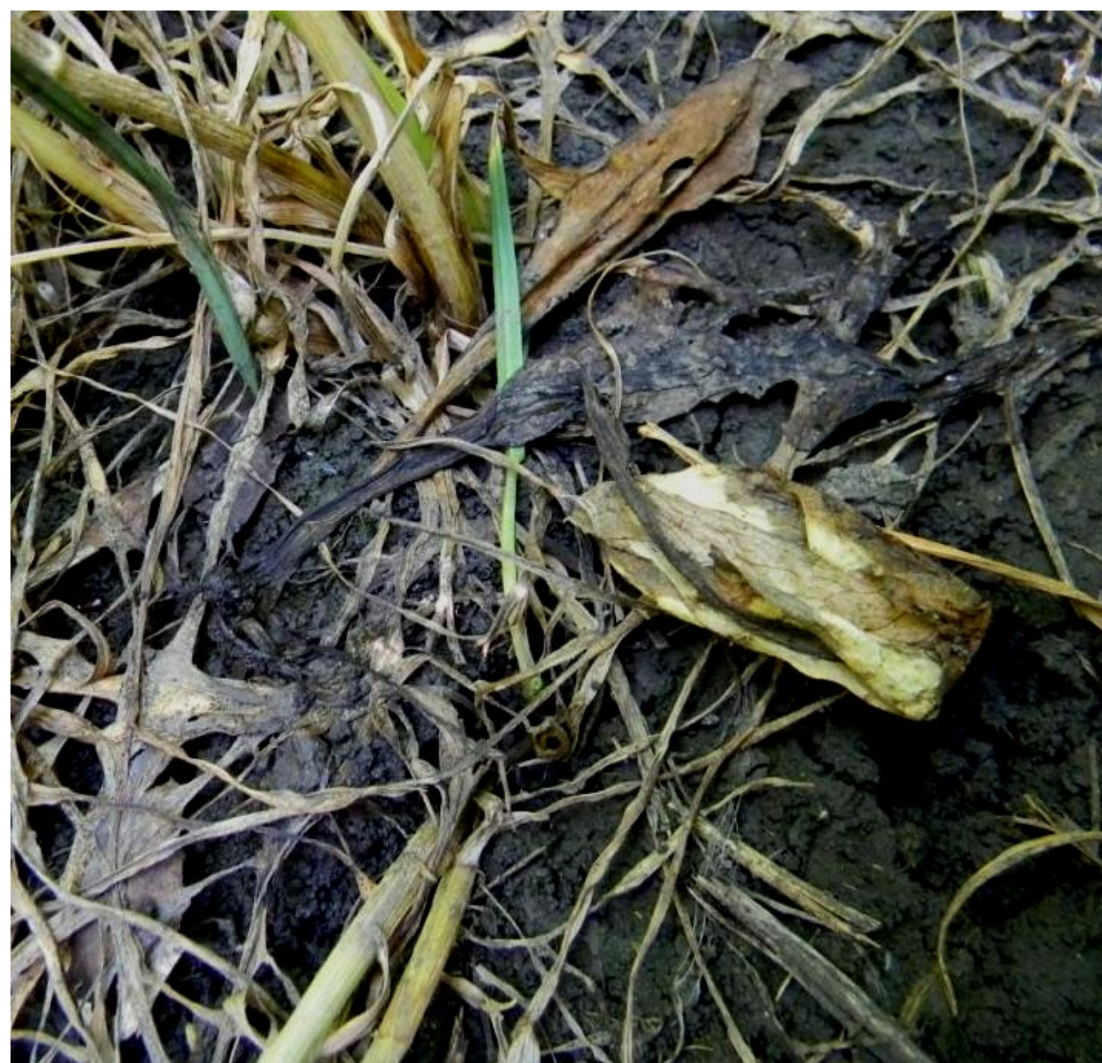
Бомба, 25 г/га