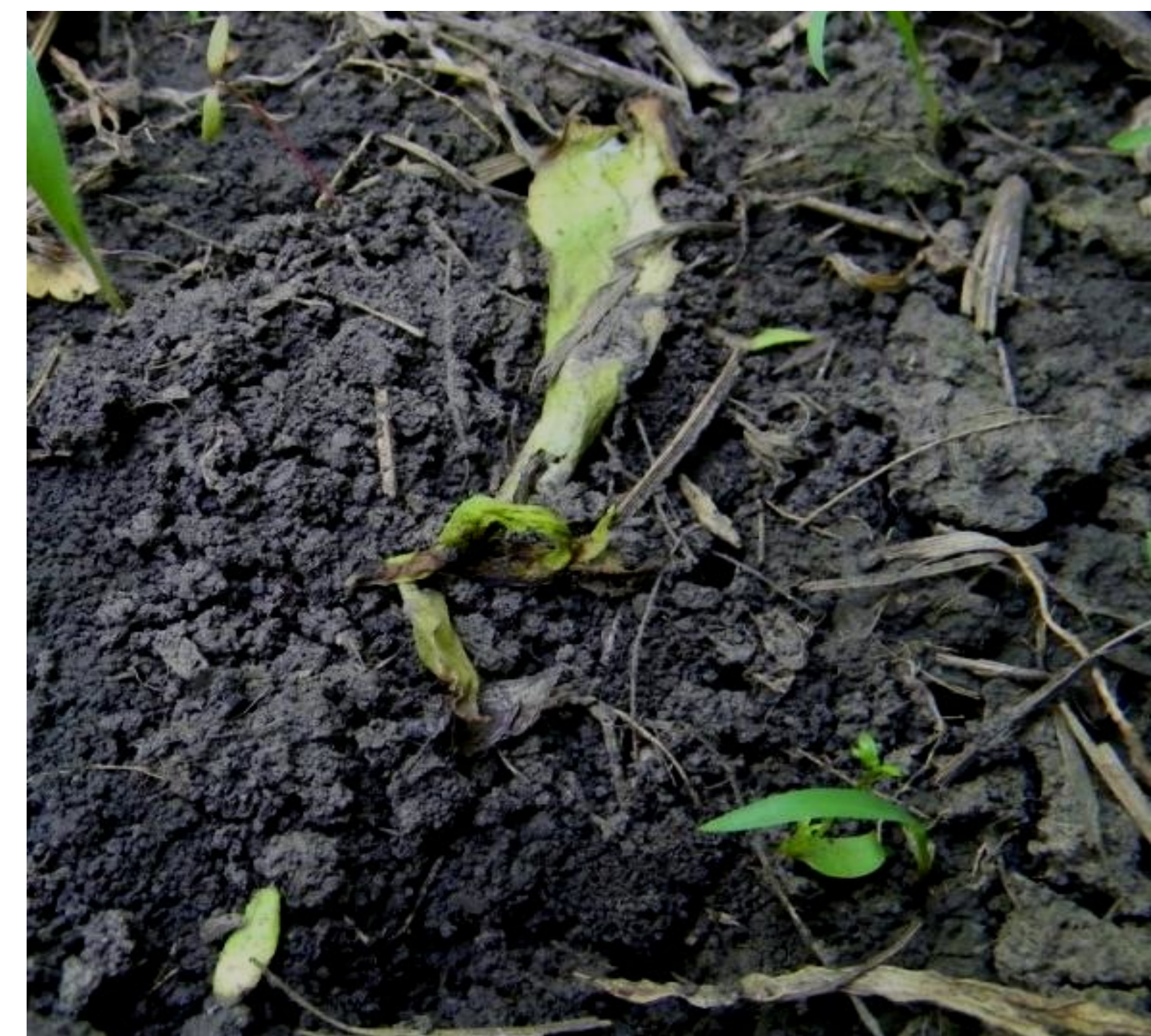
Бомба, 30 г/га