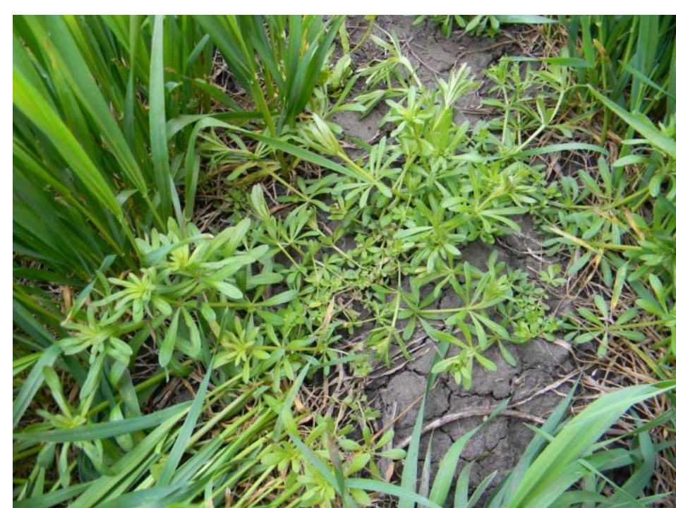
через 10 суток