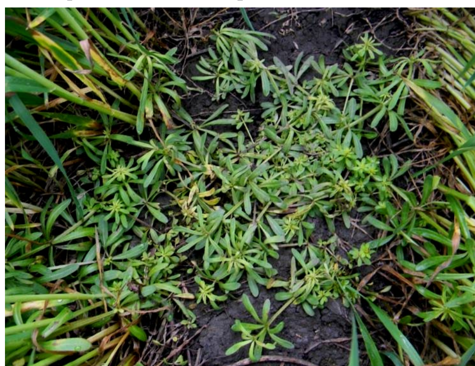
через 23 дня