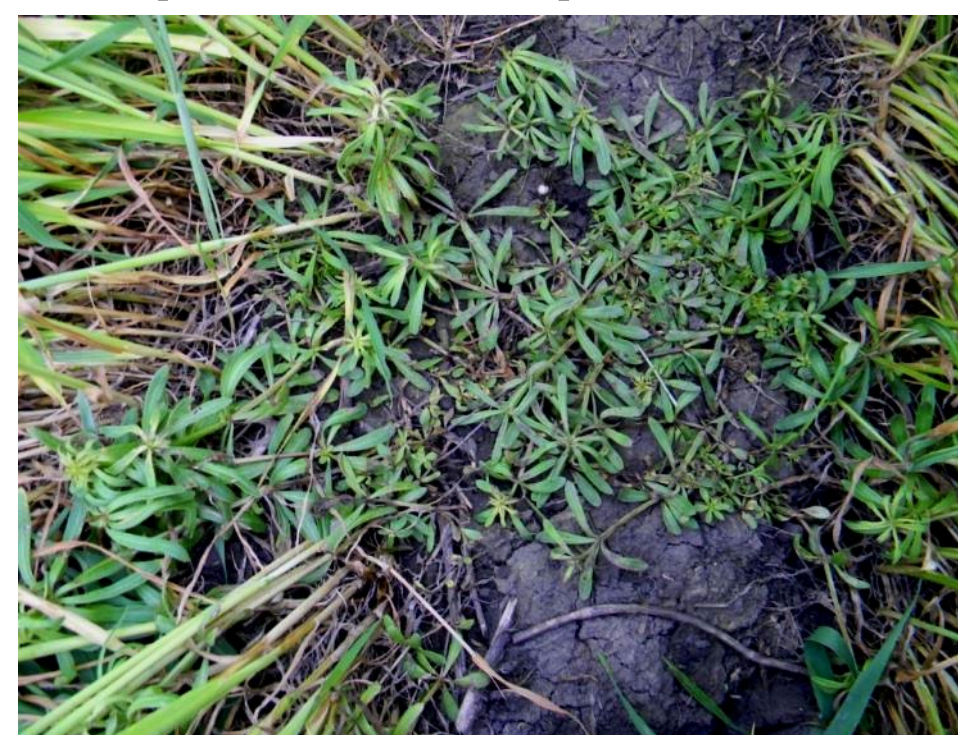
через 30 суток