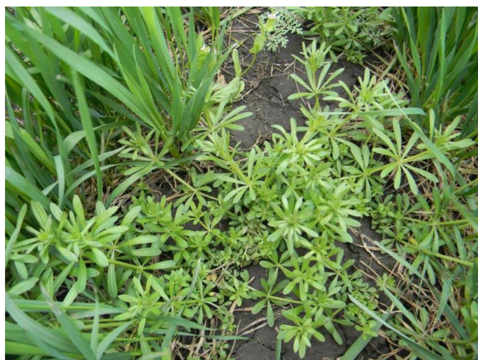
через 5 суток

Краснодарский край. Бомба, 25 г/га + Адью, 0,2 л/га против подмаренника