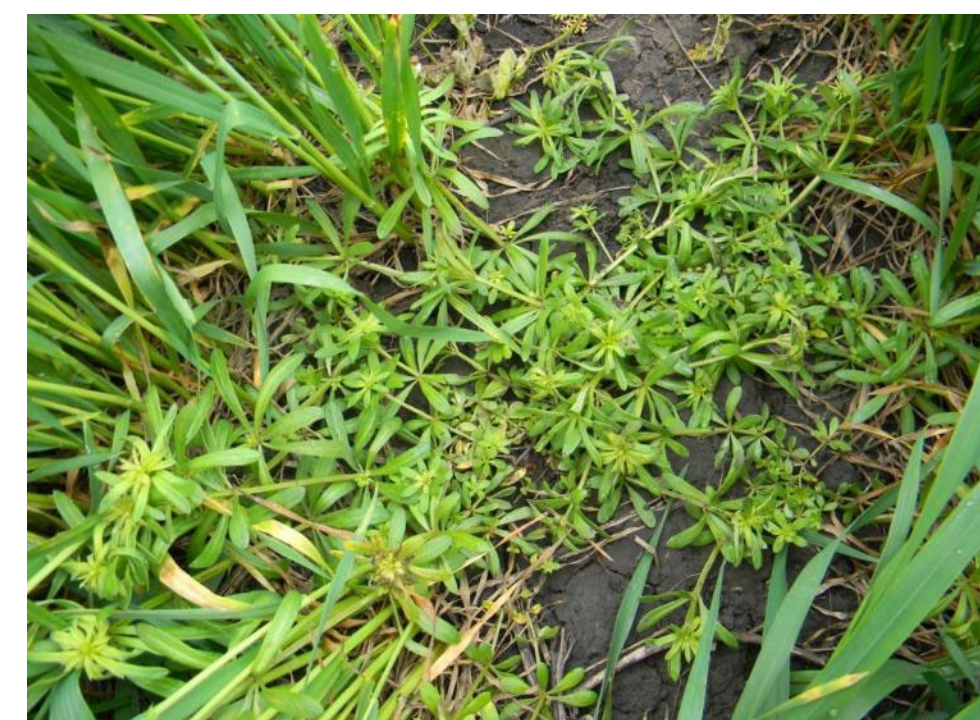
через 15 суток